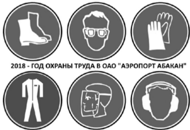
2018 - ГОД ОХРАНЫ ТРУДА В ОАО "АЭРОПОРТ АБАКАН"

В заключение хочется добавить, что главной нашей целью является не только создание безопасных условий труда, но и повышение социальной ответственности и дисциплины труда каждого сотрудника нашего предприятия, так как ни размер заработной платы, ни уровень рентабельности предприятия не могут служить основанием для пренебрежения требованиями охраны труда, правилами безопасности и оправданием существующих угроз жизни или здоровью. Помните – каждый из вас для нас большая ценность, берегите себя и соблюдайте требования охраны труда!